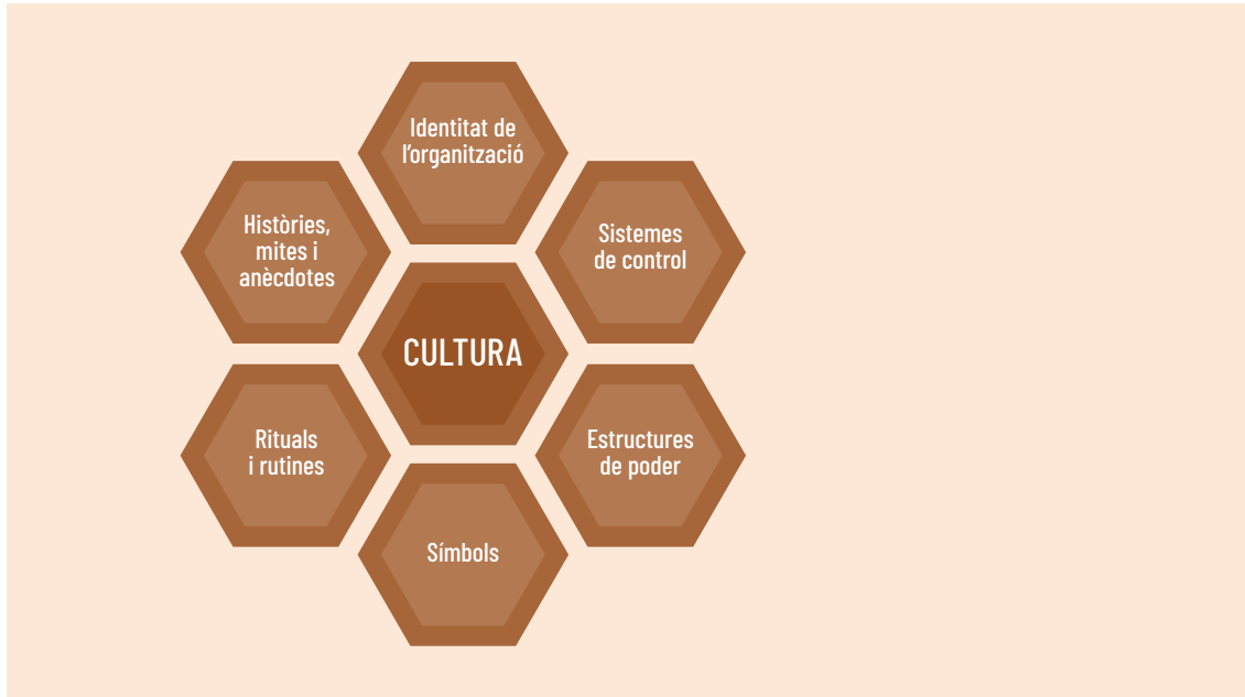
Figura 1. Elements de la cultura organitzativa